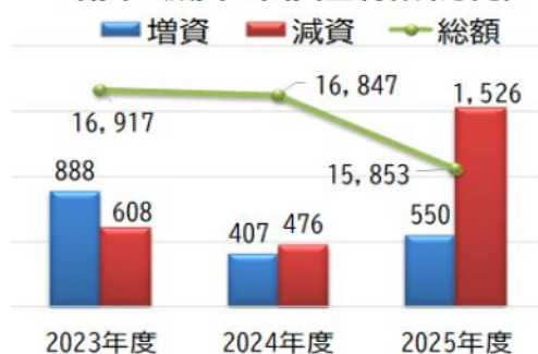
出資金 増資・減資と出資金総額(万円)

(2ページより) ③減資が増えるなかでも今年度は1500万円の減資(脱退による減資が要因)。増資を加えても1千万円の出資金減になりました。