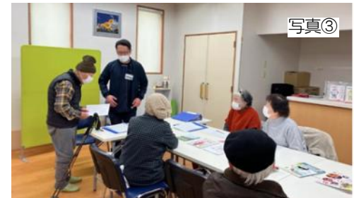
写真③ 修了式の様子 (修了者の感想を聞いています)

そこでスタッフがバスでの買い物に同行し、「一人でも大丈夫」な状態を確認することで自信を取り戻される「バスで買い物に行ける」自立した状態で12回のプログラムを修了されました。修了後に自立した生活を維持するためには、社会や家庭での役割を増やしたり、通いの場に参加することが重要です。