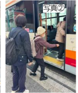
写真①② バスでの買い物練習