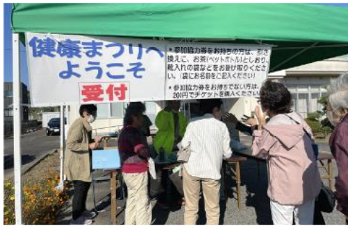
賑わう受付の様子 180人を超す参加者でした。