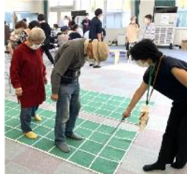
スクエアステップ