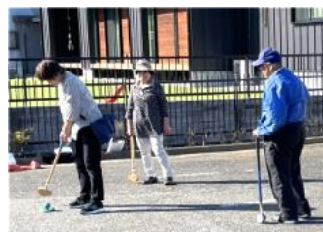
グラウンドゴルフ