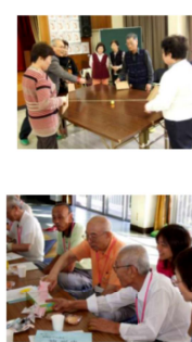
(Hikichi et al, JECH, 2015)

2日目は、全体では19に分かれて分科会が行われましたが、西濃ではそのうち第1分科会「地域に広がる平和を守る」と第9分科会「地域まるごと健康づくり」に参加しました。