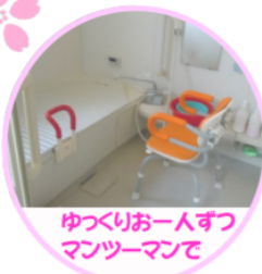
ゆつくりお一人ずつ マンツーマンで