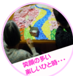
笑顔の多い 楽しいひと時・・・