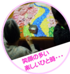
笑顔の多い 楽しいひと時・・・