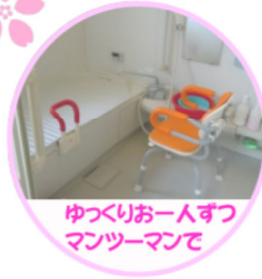
ゆつくりお一人ずつ マンツーマンで