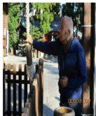
お天気も良く、皆さん自然と笑顔になりました。素敵です。