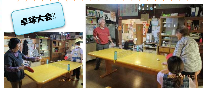
本格的な卓球大会を行いました。腕まくりをして「さあ、来い!」と言わんばかりにすごいサーブ!!若い頃に経験された方が多くすごい戦いになりました。