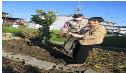
ひのき畑でさつまいもを育て、収穫しました。畑仕事は皆さん大得意!!太陽を浴びながら大きなお芋の収穫をしました。