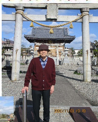
楯築神社まで散歩しました。日光浴にもなりました。