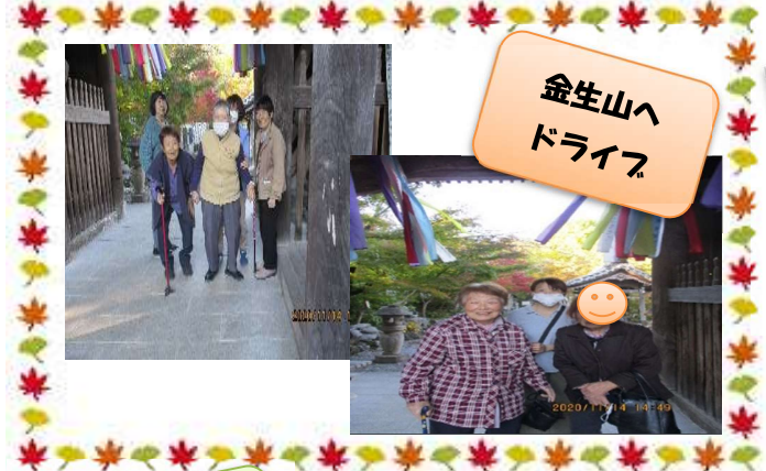
金生山へドライブ