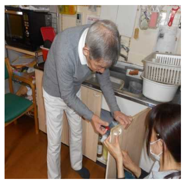
流し台の扉補修のお手伝いをして下さいました。