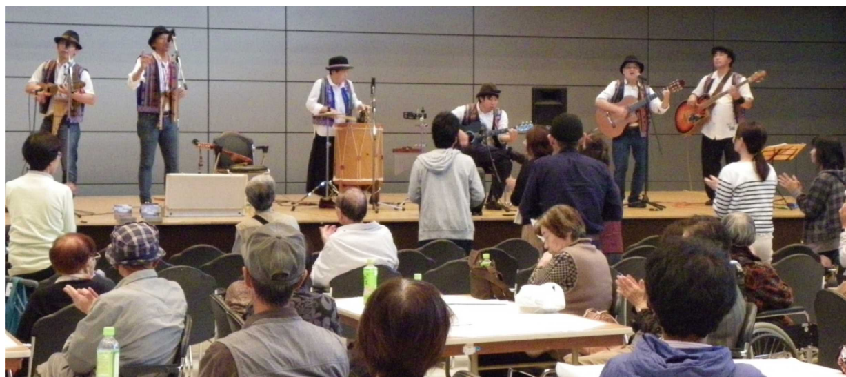
舞台の最後を飾ったのは、南米民族音楽バンド・ティエラブランカの皆さん。7年前に続いて2回目の出演でした。有名な「コンドルは飛んでいく」