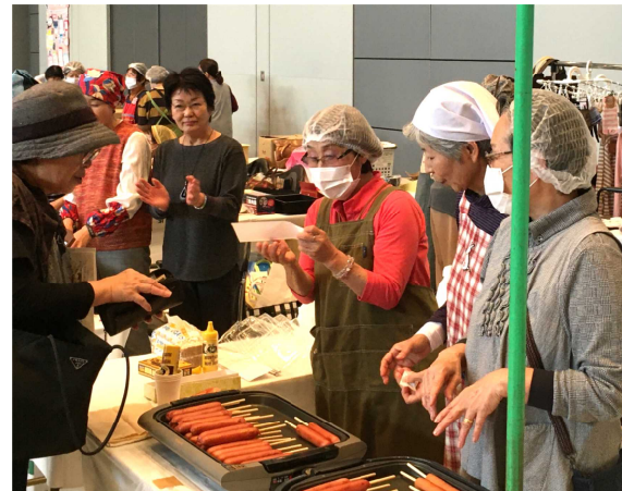
支部のバザー出店コーナー