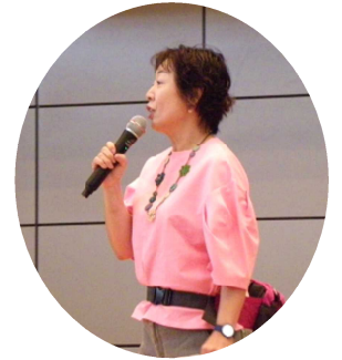
玄 瞳さんの司会で スタート