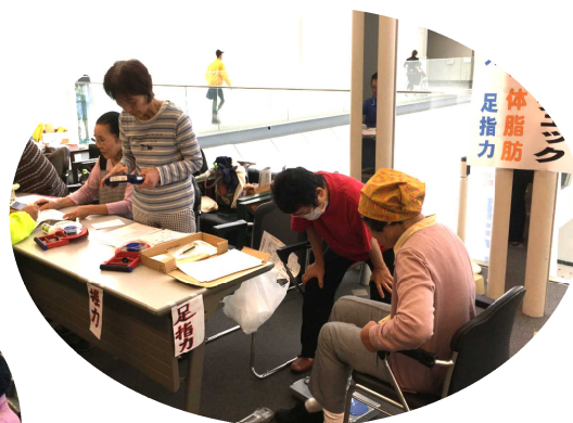
健康委員による血圧・体脂肪・握力・足指力チェックも好評でした。