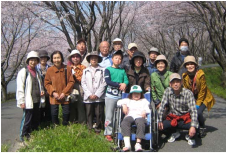
3月31日、赤坂支部恒例の花見ハイキングを宇留生支部と合同で開催。18人の組合員、ご家族の方々の参加がありました。